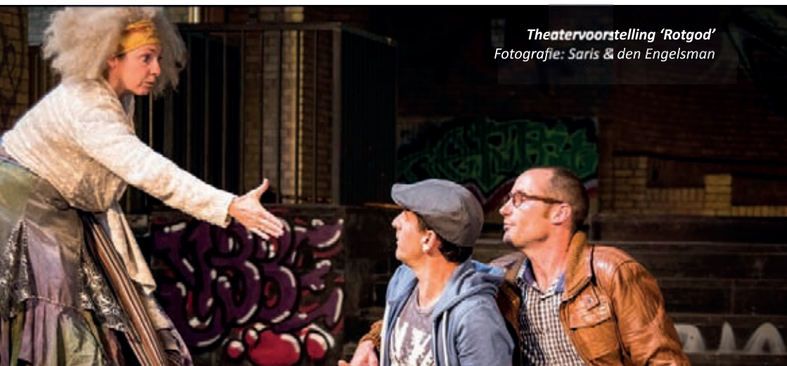
Theatervoorstelling 'Rotgod!