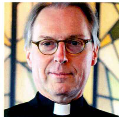
BISSCHOP DE KORTE (referent voor kerk en samenleving)

In het programma is rekening gehouden met een gratis bezoek aan de tentoonstelling Ik geef om jou! Naastenliefde door de eeuwen heen.