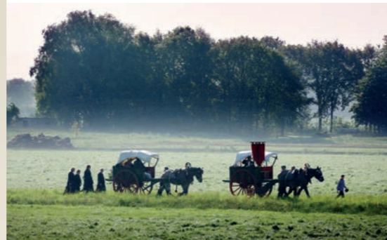
Katholiek Brabant (serie). Ramon Mangold, 2017. Collectie Museum Krona

Letterlijk en figuurlijk is de Sint Jan van centrale betekenis voor de Bosschenaren, voor feestelijkheden en plechtigheden. Voor de doop, het huwelijk, het afscheid, voor de zondagsmis en voor het bezoek tijdens kerst aan de levende kerststal.