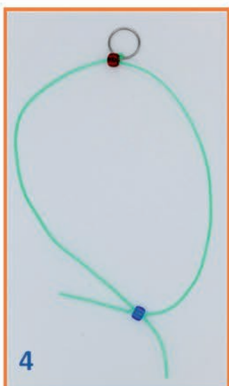
4 ze kraal op zelfde wijze