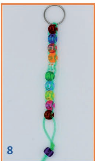
8 10e kraal + knoopje eronder