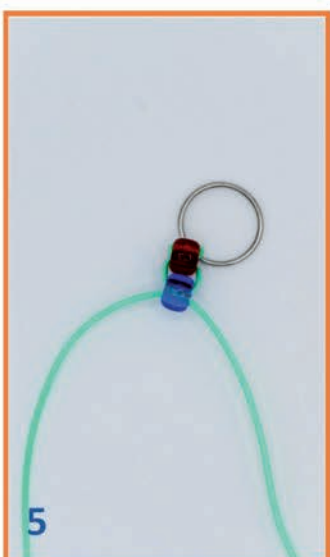
5 Draad weer aantrekken