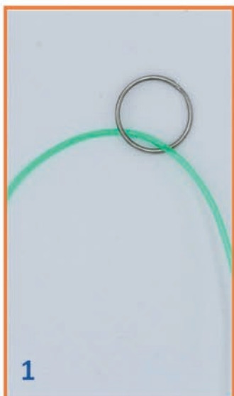
1 Draad door sleutelring