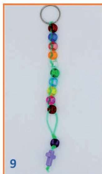
9 Kruisje aan 1 draad, knoopje