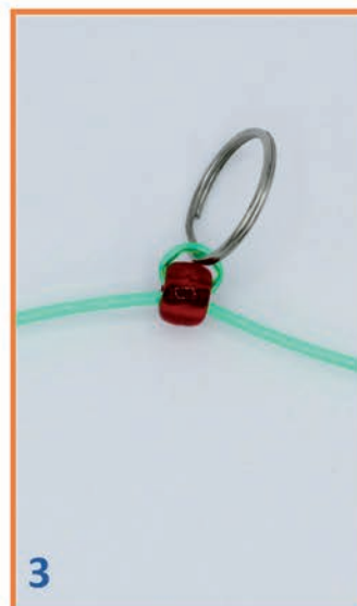
3 Links en rechts aantrekken