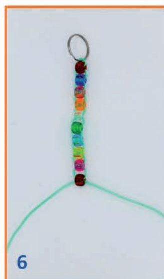
6 Zo 9 kralen rijen