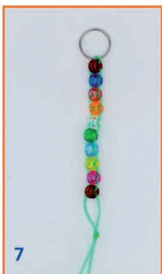
7 Ruimte laten tot knoopje