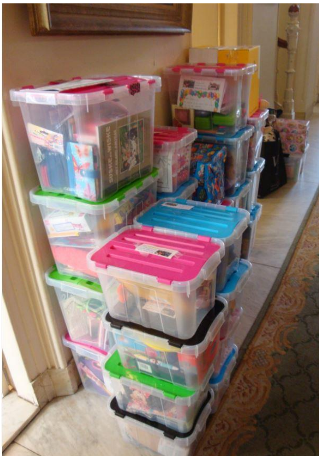
Dozen staan klaar om naar de Stichting Sonshine te vervoeren