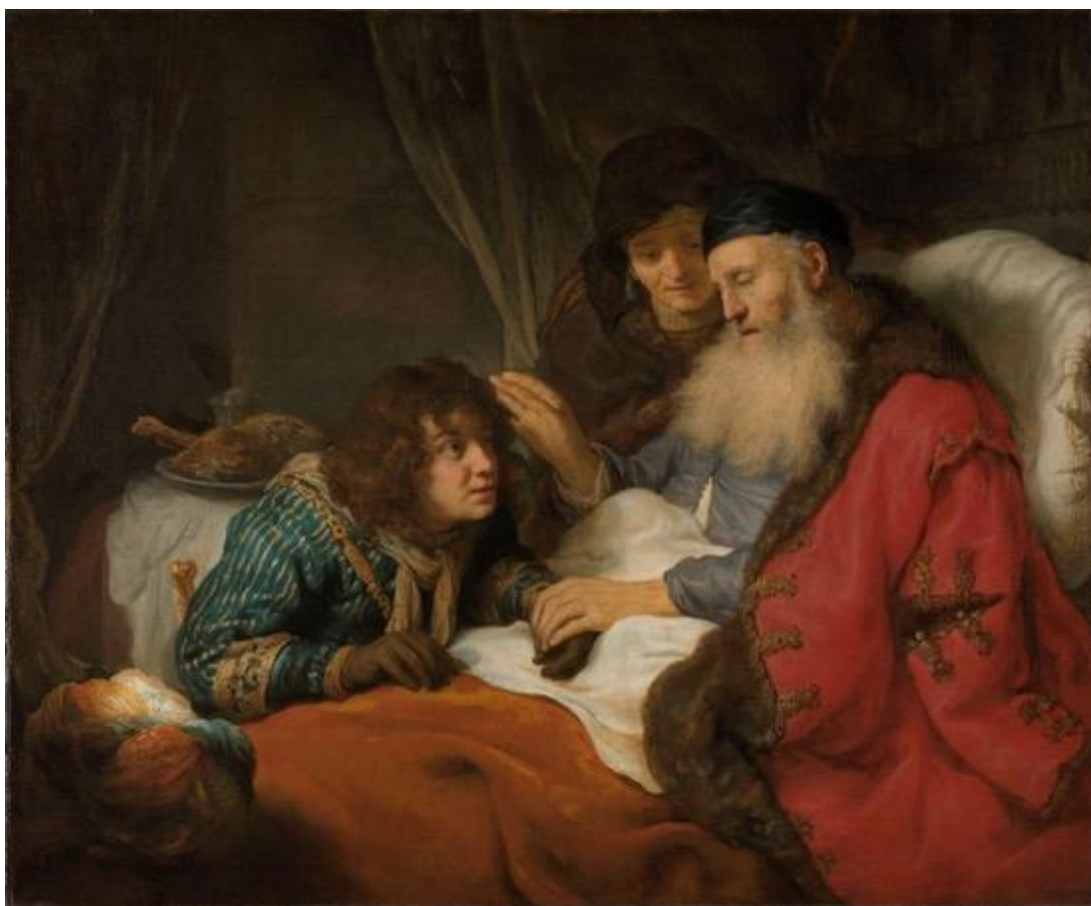
De leugen van Jacob naar Isaak.

Het antwoord op deze vraag blijkt moeilijk. In de geschiedenis van het christendom, zijn zowel de absolute afkeur van de leugen, als ook de pogingen om een uitvlucht te vinden, op tal van manieren onderzocht en besproken. In deze lezing bekijken we welke standpunten er zoal zijn ingenomen en waarom sommige kerkvaders vonden dat men niet altijd even streng moest zijn. We zoeken zo naar een antwoord op de vraag of liegen nu absoluut fout is, of dat er soms uitzonderingen denkbaar zijn. En als dat laatste dan zo is, wat moeten we dan vinden van het achtste gebod dat het liegen verbiedt?