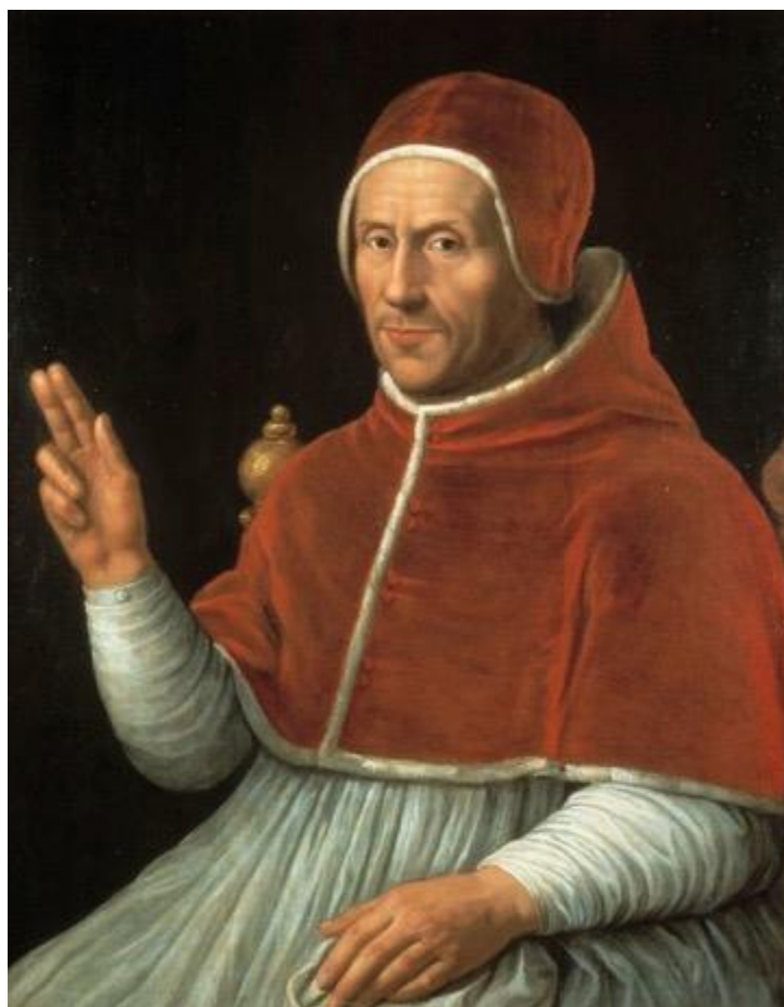
Paus Adrianus VI

Paus Adrianus zag dit gebeuren en trad als priester, geleerde, politicus en paus hiertegen op. Hij wees de mistoestanden in de kerk aan, betuigde spijt daarover en riep op tot hervorming. Het ontbrak hem niet aan goede wil. Zijn pontificaat was echter te kort om zijn goede bedoelingen vruchten te laten dragen. Treffend staat daarom ook op zijn graf geschreven: "Ach hoeveel hangt ervan af in welke tijd het werk ook van de beste man valt".