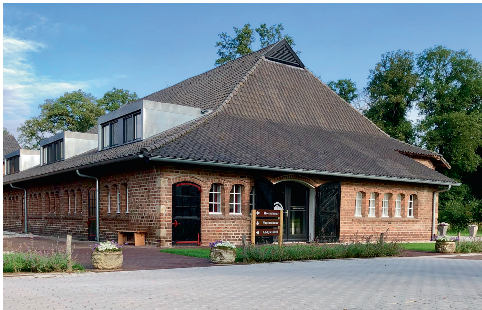
Sint-Willibrordsabdij Abdijlaan 1, 7004 JL Doetinchem Oktober 2023